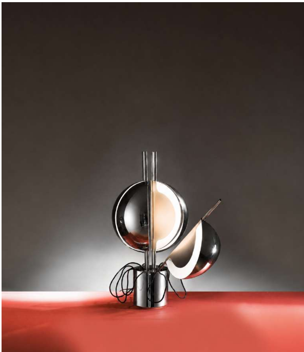
Lampe de Jean-Pierre Vitrac, modèle 10479. Inox et acier chromé. Édition Verre Lumière, France, circa 1970. H : 77 cm. Diam. de la base : 17,4 cm. Diam. de la sphère : 36,5cm